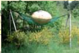
FAULES EI Rosemarie Braun