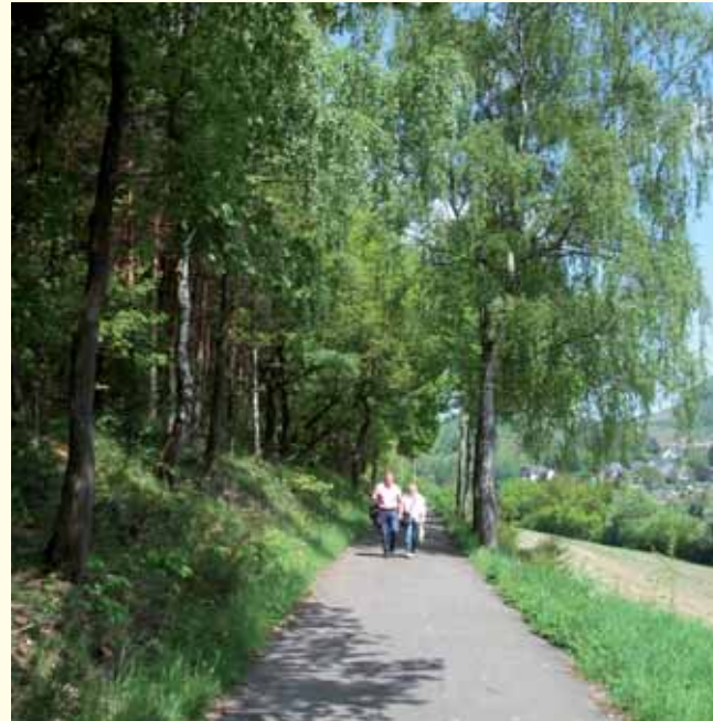
Bei jeder Witterung ein Erlebnis – der Stockumer Skulpturenweg