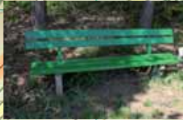
Alle Ruhebänke am Stockumer Skulpturenweg wurden in den letzten zwei Jahren instand gesetzt