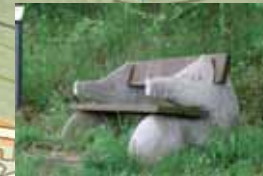
WILDBRET MIT BOWLE Friedhelm Freiburg