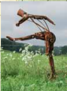
TOR Werner Neuhaus