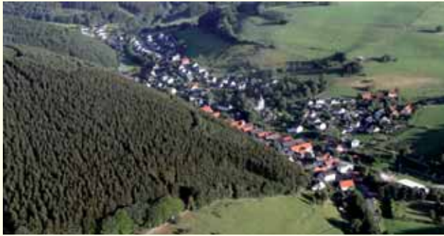
Luftaufnahme von Hagen – mit dem Justenberg im Vordergrund